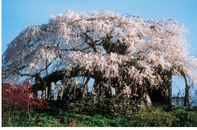
石畳東のシダレザクラ