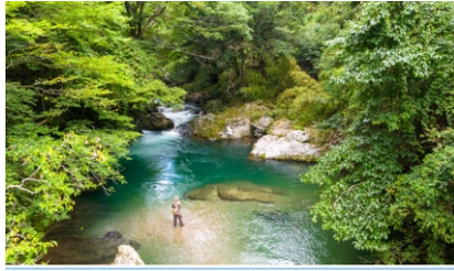
新緑の小田原山渓谷 愛媛県の南子エリアの入り口にある内子町には、量産地・小田原山渓谷があります。紅葉が有名ですが、緑溢れる遊歩道は5月から初夏にかけて訪れるのもおすすめです。新緑のシーズンは季節の花々を眺めながら森林浴が楽しめます。渓谷内には、池が注ぐという言い伝えのある安楽自訓（あまさだふち）や、高門宮殿下による命名で知られる藤見河原などの自然美を堪能できるスポットも点在。5月から6月にかけては薄紅白色の岩ツツジや標の花が見頃を迎えます。渓流釣りやキャンプも楽しめます。 ※渓流釣りは、産卵川魚種の産卵が必要で、