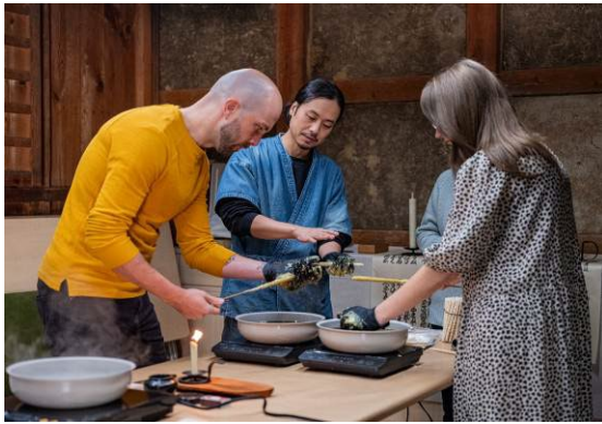
和ろうそく作り体験作業風景