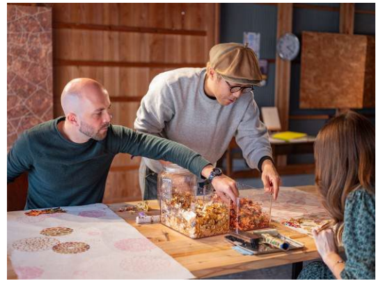
ギルディング和紙タペストリー作り作業風景

モニターツアー、販促ツール作成、ガイド育成、ファムトリップ、商談会参加などを行い、令和8年1月より販売開始しました。令和8年5月現在、和ろうそく体験の申し込みは5件、ギルディング和紙タペストリー体験の申し込みは2件と順調な滑り出しとなっています。