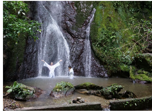
滝打たれ体験（イメージ）

◆出発日:2022年7月24日(日)、8月28日(日)、9月11日(日) 日帰り